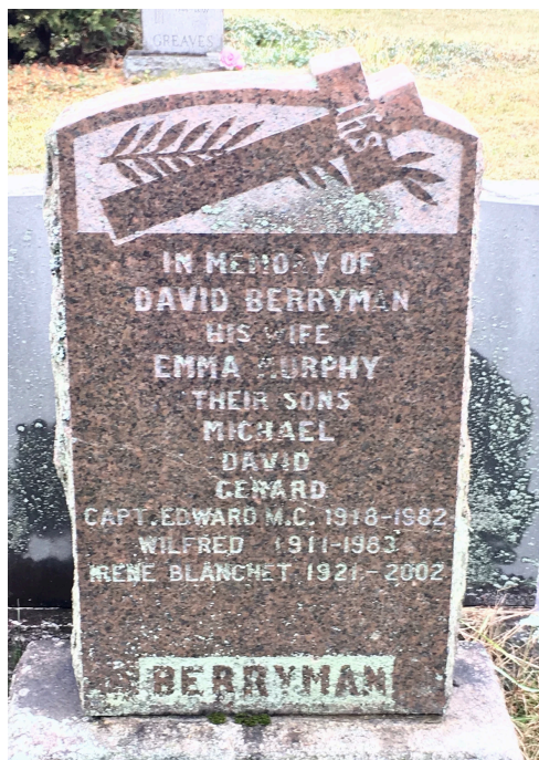
Cimetière de SBDL